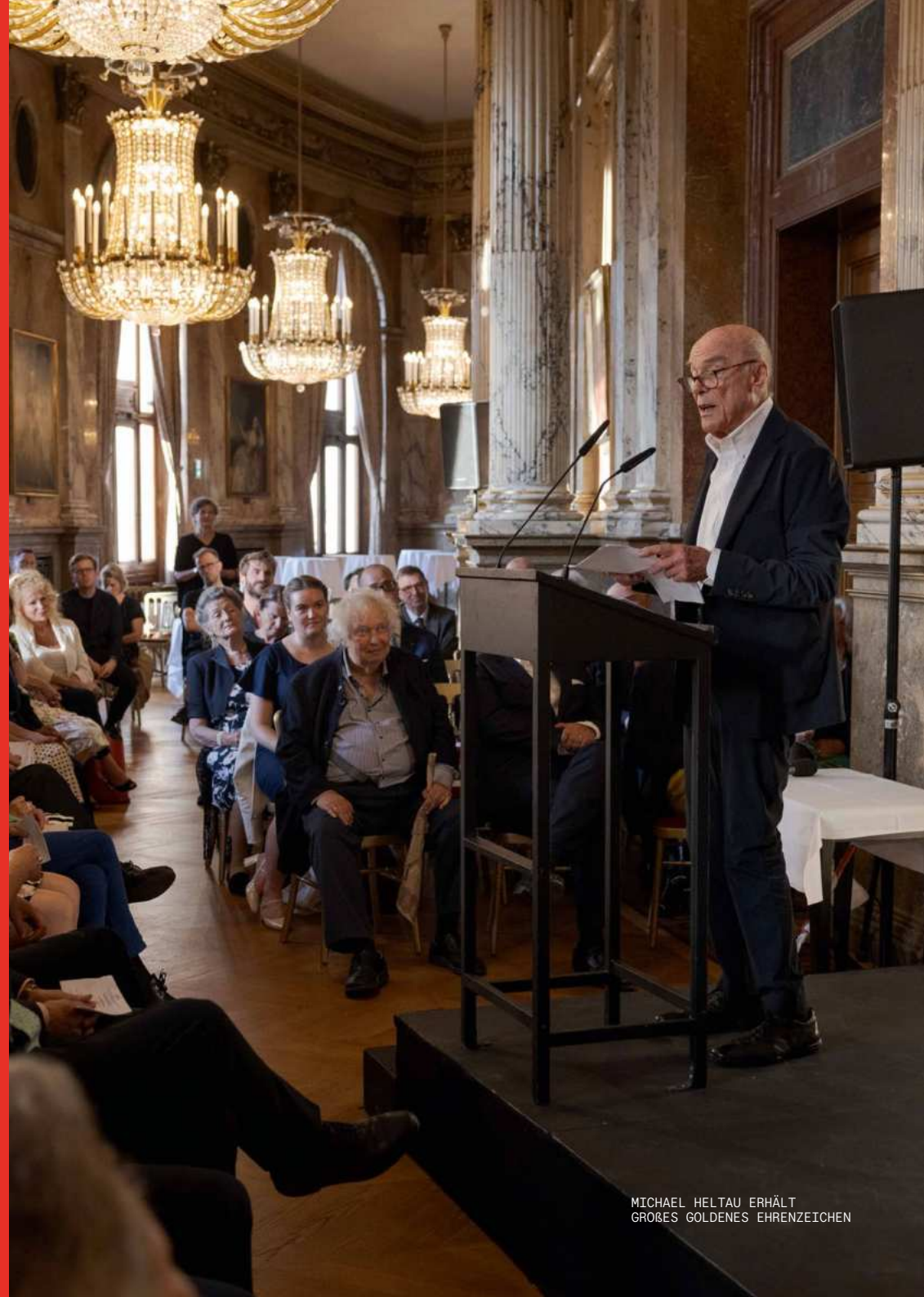
MICHAEL HELTAU ERHÄLT GROßES GOLDENES EHRENZEICHEN